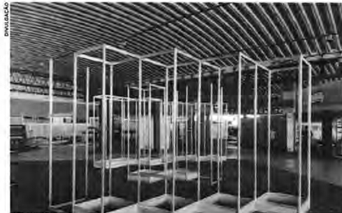
O evento acontecerá de 9 a 12 de novembro

Em ritmo acelerado, a montagem da estrutura da quinta edição da Expo Indústria Maranhão já está adiantada no Multicenter Negócios e Eventos (Cohafuma). Com expectativa de movimentar o mundo dos negócios maranhenses, a feira reunirá milhares de pessoas de 9 a 12 de novembro. Realizada pelo Sistema FIEMA (SESI, SENAI e IEL) e pela CNI, a Expo Indústria Maranhão chega à sua quinta edição com expectativa de gerar cerca de R$ 290 milhões em negócios. Com o tema "Indústria - o futuro passa por aqui", a Expo Indústria oferece a seus visitantes uma vasta programação com rodadas de negócios (nacional e internacional), palestras, oficinas, bate-papos, painéis etc. A feira deve reunir cerca de 25 mil visitantes, entre empresários, investidores, expositores, fornecedores, estudantes e público em geral. Além dos mais de 150 estandes, o público poderá visitar os espaços da Arena Sustentável, Plenarium, Cozinha Show, Expo Lounge, Expo Party, Rodada de Negócios, Arena do Crédito, Expo Agro, Expo Turismo, Expo Produtos, Expo Arte e Expo Show e ainda participar do Encontro IEL de Estágio, Carreira e Gestão e do Maranhão Fashion Week 2023. Há menos de uma semana da abertura da quinta edição da Expo Indústria, a estrutura está sendo preparada nos mínimos detalhes. Os estandes, dispostos no pavilhão Multicenter e no Cenro de Convenções, totalizando uma área de mais 20.000 m 2 , dão um panorama das iniciativas industriais e comerciais do