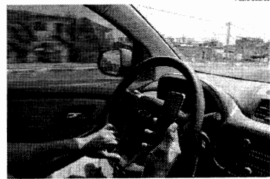
Dirigir usando o celular já rendeu muitas e acidentes em todo o estado

Durante entrevista à imprensa, o governador ressaltou que há baixa procura pela segunda dose da vacina em todo o Maranhão, e que o encurtamento do espaço entre as doses pode ser uma solução. “Se você tem um estoque dedicado a segunda dose e as pessoas não vão, por alguma razão, nós temos que fazer alguma coisa com a segunda dose das vacinas. Nós não vamos esperar eternamente, então estamos aguardando”, disse. De acordo com os dados disponibilizados pelo Consórcio de Imprensa, apenas 10,23% de toda a população, incluindo menores de 18 anos, receberam a segunda dose da imunização. ●