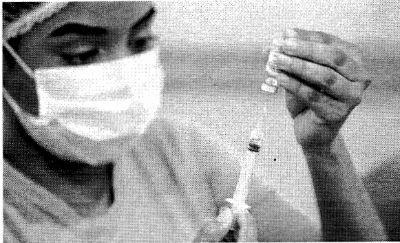
Caso os lotes de vacina AstraZeneca estejam próximos do fim do prazo de validade, segunda dose pode ser adiada

Em nota a O Estado, a Secretaria Municipal de Saúde de São Luís (Semus) informou que, por meio do comitê específico de análise do Plano Municipal de Vacinação, está ciente da mudança de posicionamento de