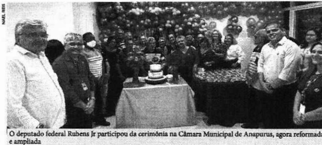
O deputado federal Rubens Jr participou da cerimônia na Câmara Municipal de Anapurus, agora reformada e ampliada

Neste domingo (13), o Governo do Estado entregou reformado e ampliado o prédio onde funciona a Câmara Municipal de Anapurus. Na ocasião, estavam presentes o secretário-adjunto de Articulação Política, Raimundo Reis; a prefeita de Anapurus, Vanderly Monteles; o deputado federal Rubens Júnior e o presidente da Câmara Municipal de Anapurus, Ademar Esteves de Santana. "A entrega do novo prédio da Câmara integra o conjunto de parcerias importantes que o Governo do Estado faz com todos os municípios do Maranhão. Estamos felizes por mais essa conquista", disse o secretário-adjunto de Articulação Política, Raimundo Reis.